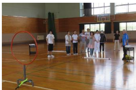
フライングディスク