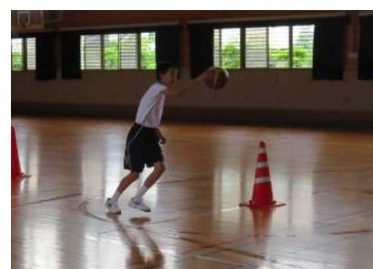
バスケットボール