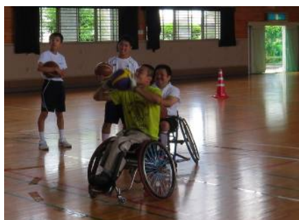
バスケットボール